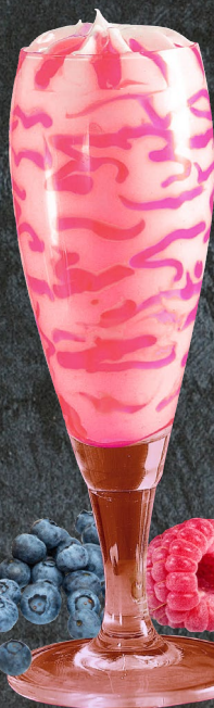
Flûte Frutti di Bosco