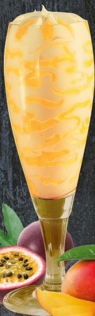
Flûte Mango e Passion Fruit